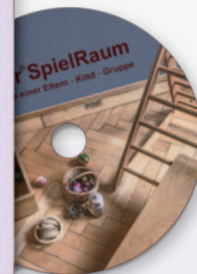
Pikler®SpielRaum – Erlebnisse einer Eltern-Kind-Gruppe Ein Film von Stephanie Küpper und Laura Lazzarin